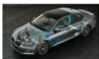
Adaptivní podvozek – volitelné nastavení podvozku ve 3 režimech (Comfort, Normal, Sport)

ŠKODA usnadňuje život svým zákazníkům každý den.