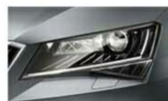
Smart Light Assist – automatické přepínání a clonění dálkových světel