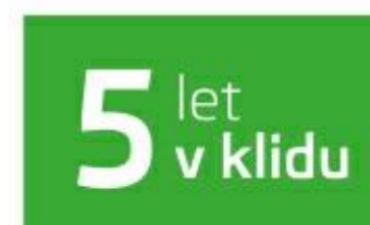
Předplacený servis na 5 let / 100 000 km při financování od ŠKODA Finance