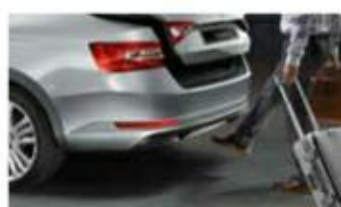
Virtuální pedál – bezdotykové otevření 5. dveří